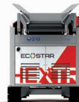
Hextra modello cingolato