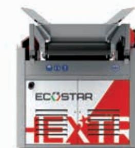
Hextra modello scarrabile